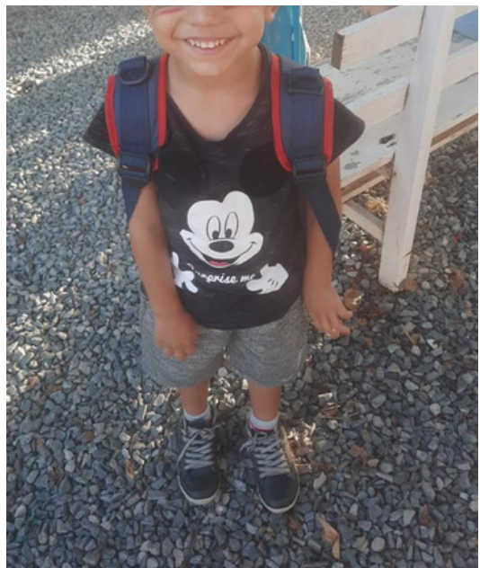
N.H. no dia do índio