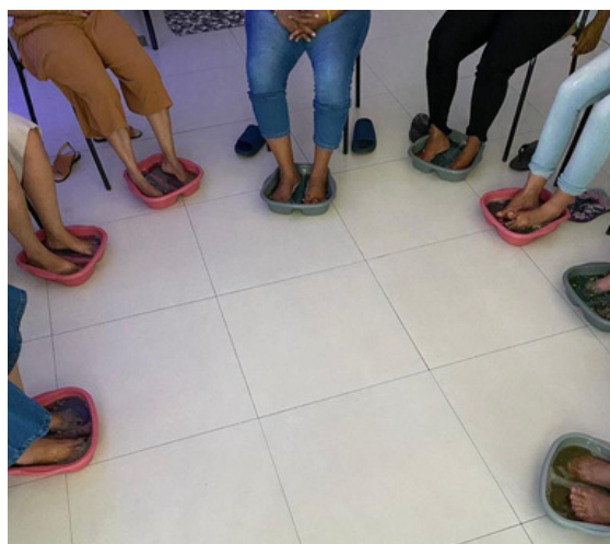
momento de relaxamento no dia das mulheres

O Larzinho valoriza a força da mulher e procura sempre cuidar delas com muito carinho e respeito.