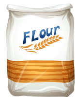
Farinha de mandioca